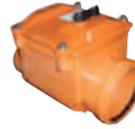
HT-PP Villa Tipi Kilitli Çekvalf