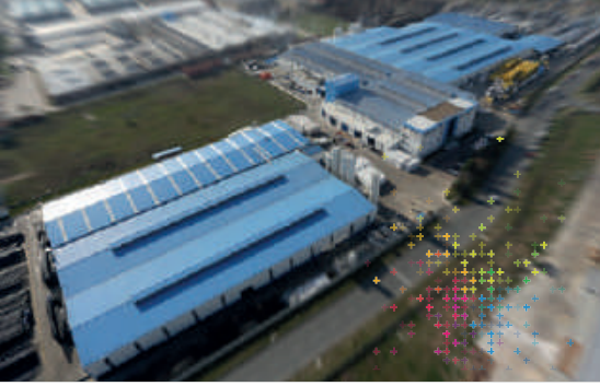
Georg Fischer Hakan Plastik Çerkezköy Üretim Tesisleri

Georg Fischer 1802 yılında kurulmuş İsviçre merkezli bir firmadır. 3 ana iş kolunda faaliyet göstermektedir: GF Piping Systems (Boru Sistemleri), GF Casting Solutions (Hafif Döküm Çözümleri) ve GF Machining Solutions (Talaşlı İmalat Çözümleri). 32 ülkede 45 üretim tesisine sahip GF, boru sistemleri alanında plastik ve metalden yapılmış boru sistemleri konusunda dünyadaki lider kuruluşlardan biridir. GF Piping Systems (GFPS), su ve gazın sanayi, kamu hizmetleri ve yapı teknolojisi içinde güvenli bir şekilde taşınması için sistem çözümleri ve yüksek kaliteli bileşenler üretmektedir. 3 ana gruba sahip GFPS, üst yapı, alt yapı ve endüstriyel alana yönelik olarak 60.000'den fazla ürün sunmaktadır.