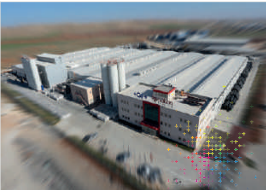
Georg Fischer Hakan Plastik Şanlıurfa Üretim Tesisleri

2013 yılında GFPS, Hakan Plastik'i satın almıştır. Türkiye'nin en önemli plastik boru ve ek parça üreticileri arasında yer alan Hakan Plastik, dünyada bu işin uzmanı olan marka ile güçlerini birleştirerek değişim için önemli bir adım atmıştır. 1965 yılında kurulan Hakan Plastik, Türkiye'de sessiz boruyu ilk üreten firma olarak büyük başarılar imza atmış, kuruluşundan beri gelişime ve değişime verdiği önemi ürün ve hizmetlerine de yansıtmıştır.