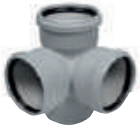
HT-PP Köşe Çift Çatal 87,5°