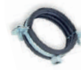
Standart Somunlu Keleççe Metal